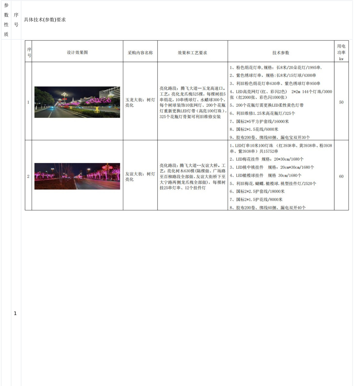
附表一: 原街路、节点亮化产品补充采购 是否允许进口: 否