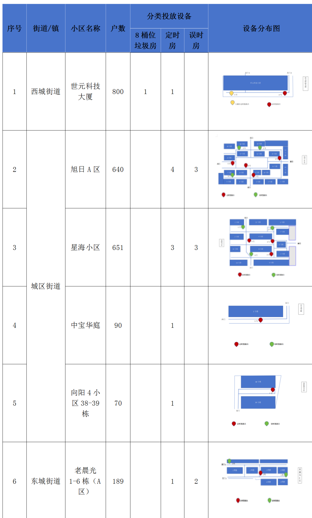
元宝山区试点小区名单