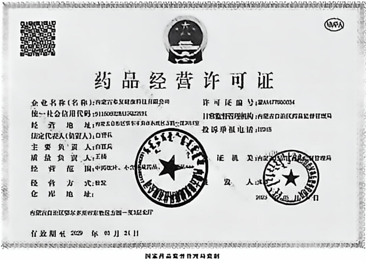
附件二、内蒙古泰复健康科技有限公司投标时提供的药品经营许可证