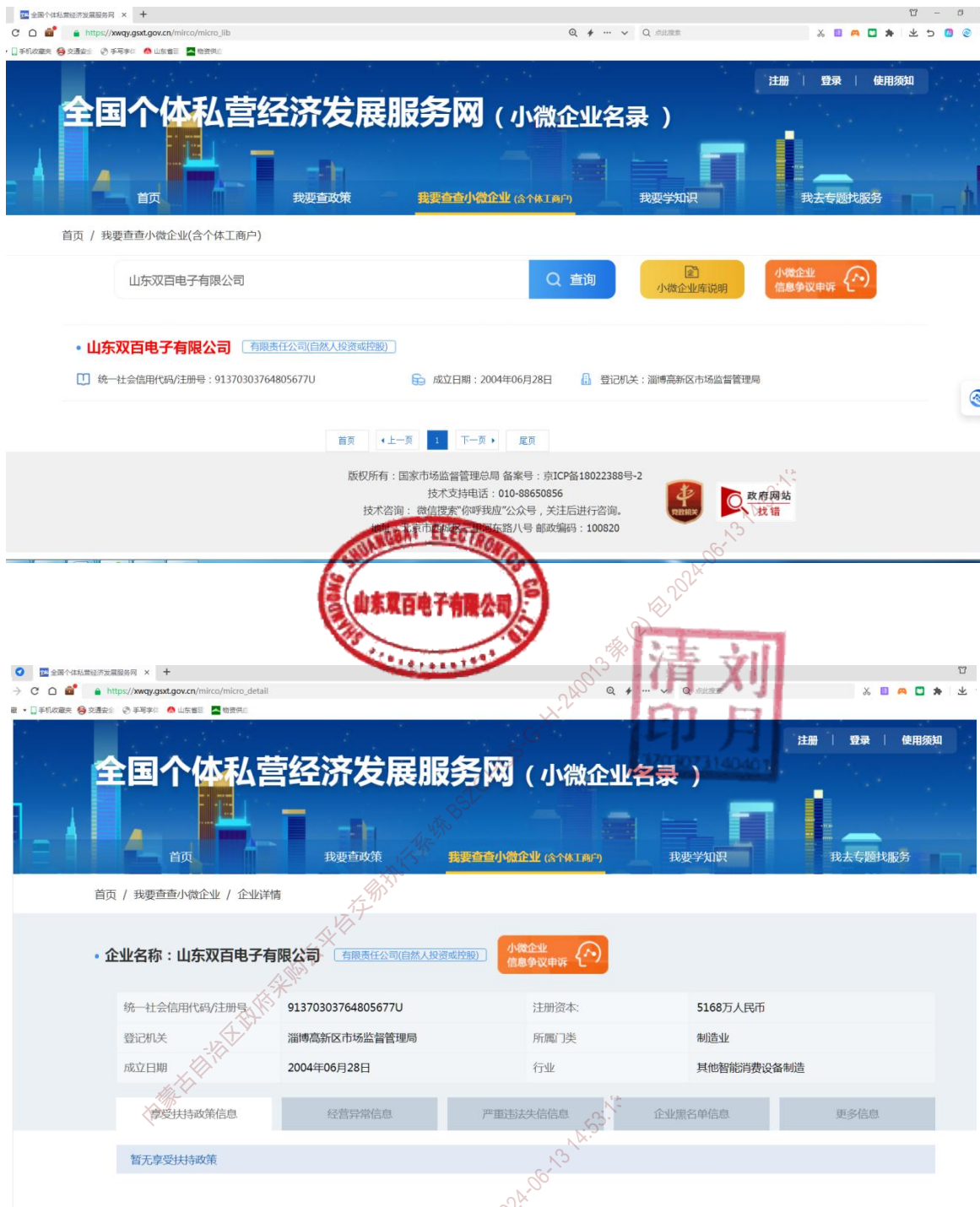
附：小微企业名录查询截图