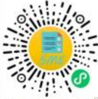
中小企业规模类型自测小程序

申明: 测试结果是依据测试者提供的所属行业和有关指标数据生成, 其信息真实性由测试者负责。