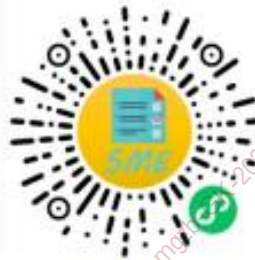
中小企业规模类型自测小程序

申明：测试结果是依据测试者提供的所属行业和有关指标数据生成，其信息真实性由测试者负责。