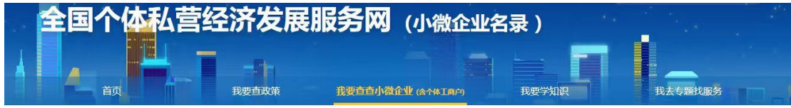
黑龙江省秸乐农业科技发展有限公司小微企业查询截图