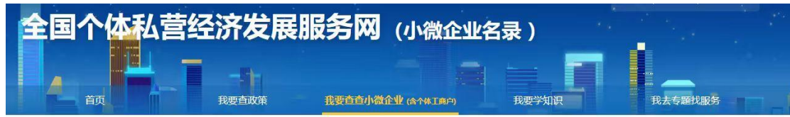
河北金土生物科技股份有限公司小微企业查询截图